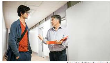
Postdocs / Juniorprofs